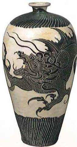
重要文化財 「白地黒揺落龍文梅瓶」 北宋時代