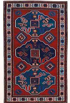
カラハフ チョンルスク、コーカサス 20世紀初期