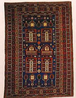
シルヴァン、コーカサス 20世紀初期