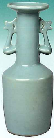
「青磁鳳凰耳花生」 南宋時代