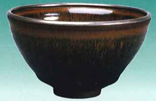
「禾目天目茶碗」 南宋時代