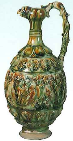
「唐三彩鳳首瓶」 唐時代

この春季展が当館85周年記念となりました。作品陳列とともに当館における中国陶磁と展覧会について振り返ってみたいと思います。