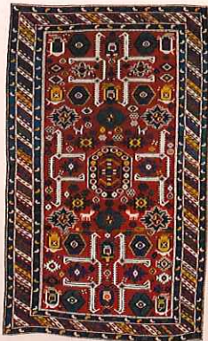
クバ(アフジャン)、コーカサス 1900年頃

言語のるつぽと称されるコーカサス。黒海とカスピ海に挟まれ、コーカサス山脈が中央に聳えるこの地は、世界で最も民族と文化が多様性に富むとされます。コーカサスで織られた絨毯は、概ね色鮮やかで、かつ抽象化された文様によって、大胆な印象を伴っています。しかし、細部を観察しますと、生産地ごとの特徴をみることができ、絨毯においてもその裾野の広さを認めることができます。白鶴美術館には、コーカサス各地の絨毯が所蔵されていますが、この展覧会は、それらを一堂に会した地方ごとの違いを紹介する初めての試みです。