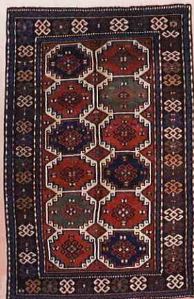
Mogan, Caucasus (モーガン, コーカサス) 20世紀初期